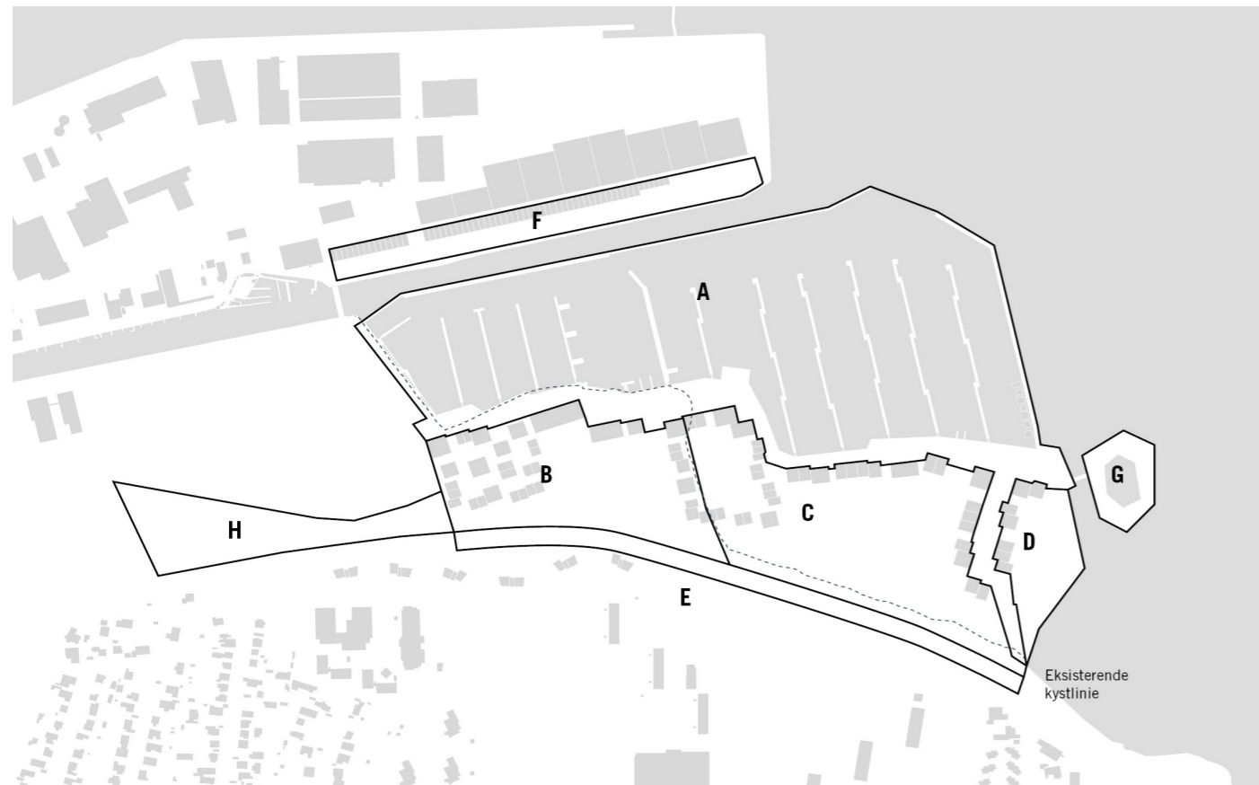
III. 1: Områdeinddeling, hvor tillægget omfatter område H.

I forbindelse med planlægningsforløbet for Marina City har der været adskillige forslag fra borgere, brugere og andre interessenter om at placere en del af projektet i det grønne område umiddelbart vest for Marina Syd. Det grønne område består dels af et større fredskovsareal samt to naturbeskyttede arealer (§3-områder i form af moser). Kolding Kommune har derfor vurderet på mulighederne herfor, og er i dialog med Miljøstyrelsen om mulighederne i fredskovsområdet. Miljøstyrelsen vil ikke tillade ændringer i fredskovsområdet, men er dog indstillet på at berigtige fredskovspligten på det viste område H, således at fredskovspligten bortfalder her.